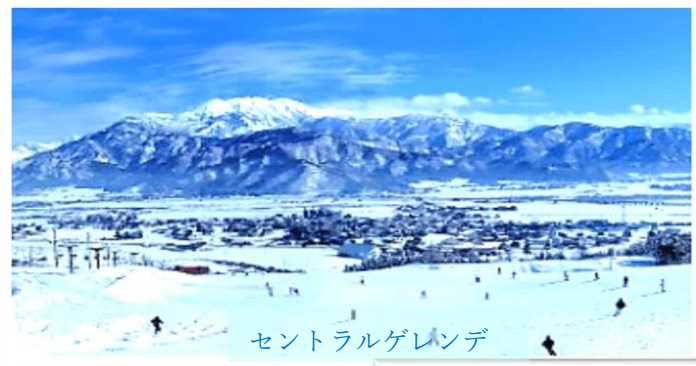
セントラルゲレンデ